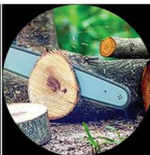
Sierra doméstica Madera