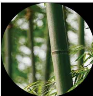
Registro de bambú