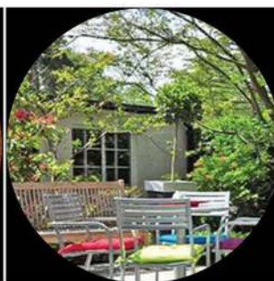
Uso del jardín trasero